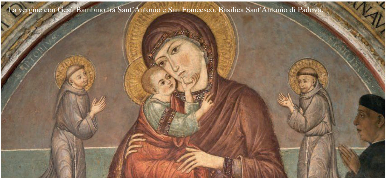
La vergine con Gesù Bambino tra Sant'Antonio e San Francesco, Basilica Sant'Antonio di Padova.

la libertà dell'uomo, realmente ferita dal peccato, non può renderla effettiva in pieno se non mediante l'aiuto della grazia divina» ( Gaudium et Spes , n. 17). L'uomo è stato creato «ad immagine e somiglianza di Dio» (cfr. Gen 1, 27), e la vera libertà è per lui sempre «un segno privilegiato dell'immagine divina» (cfr. l. cit. ). Quando siamo caduti nel peccato d'origine abbiamo sfigurato quest'immagine divina che era in noi, ma Dio non ha smesso di amarci ed è venuto nel mondo nella persona del Figlio. Gesù, figlio di Dio, si è fatto Uomo per la nostra salvezza: sulla Croce ha dato la propria vita per salvarci dalla schiavitù del peccato, e colmare di grazia la nostra vita. Lui è la Verità stessa che con voce chiara e limpida parla alla nostra coscienza e, con la sua grazia, illumina i nostri pensieri per renderci uomini liberi. È fondamentale per noi metterci in ascolto della sua «Parola» ed evitare di rimanere succubi del male, perché dice il Concilio: «Ogni singolo uomo, dovrà poi rendere conto della propria vita