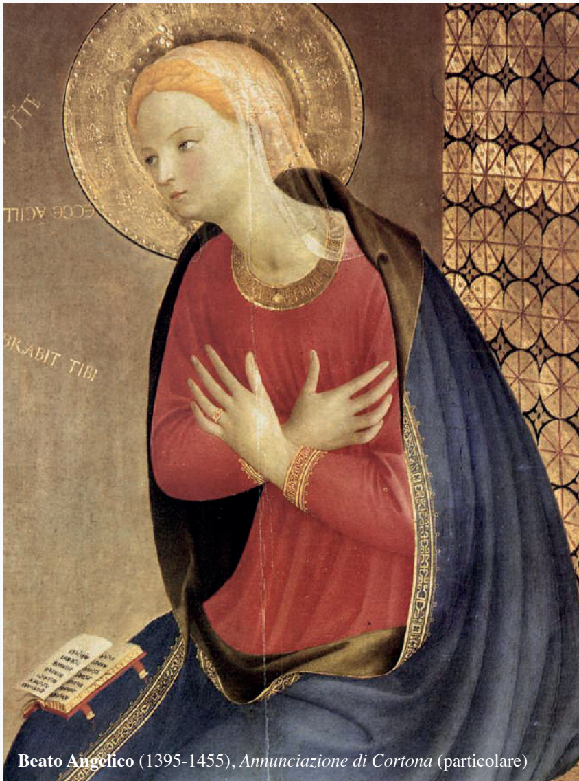
Beato Angelico (1395-1455), Annunciazione di Cortona (particolare)

messe. Essa è una donna di fede: «Beata sei tu che hai creduto», le dice Elisabetta (cfr. Lc 1, 45). Il Magnificat — un ritratto, per così dire, della sua anima — è interamente tessuto di fili della Sacra Scrittura, di fili tratti dalla Parola di Dio [cfr. Lc 1, 46-55]. Così si rivela che lei nella Parola di Dio è veramente a casa sua, ne esce e vi rientra con naturalezza. Ella parla e pensa con la Parola di Dio; la Parola di Dio diventa parola sua, e la sua parola nasce dalla Parola di Dio. Così si rivela, inoltre, che i suoi pensieri sono in sintonia con i pensieri di Dio, che il suo volere è un volere insieme con Dio.