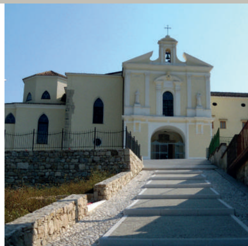
Santuario Maria SS. delle Grazie e Convento dei Frati Cappuccini CERRETO SANNITA (BN)