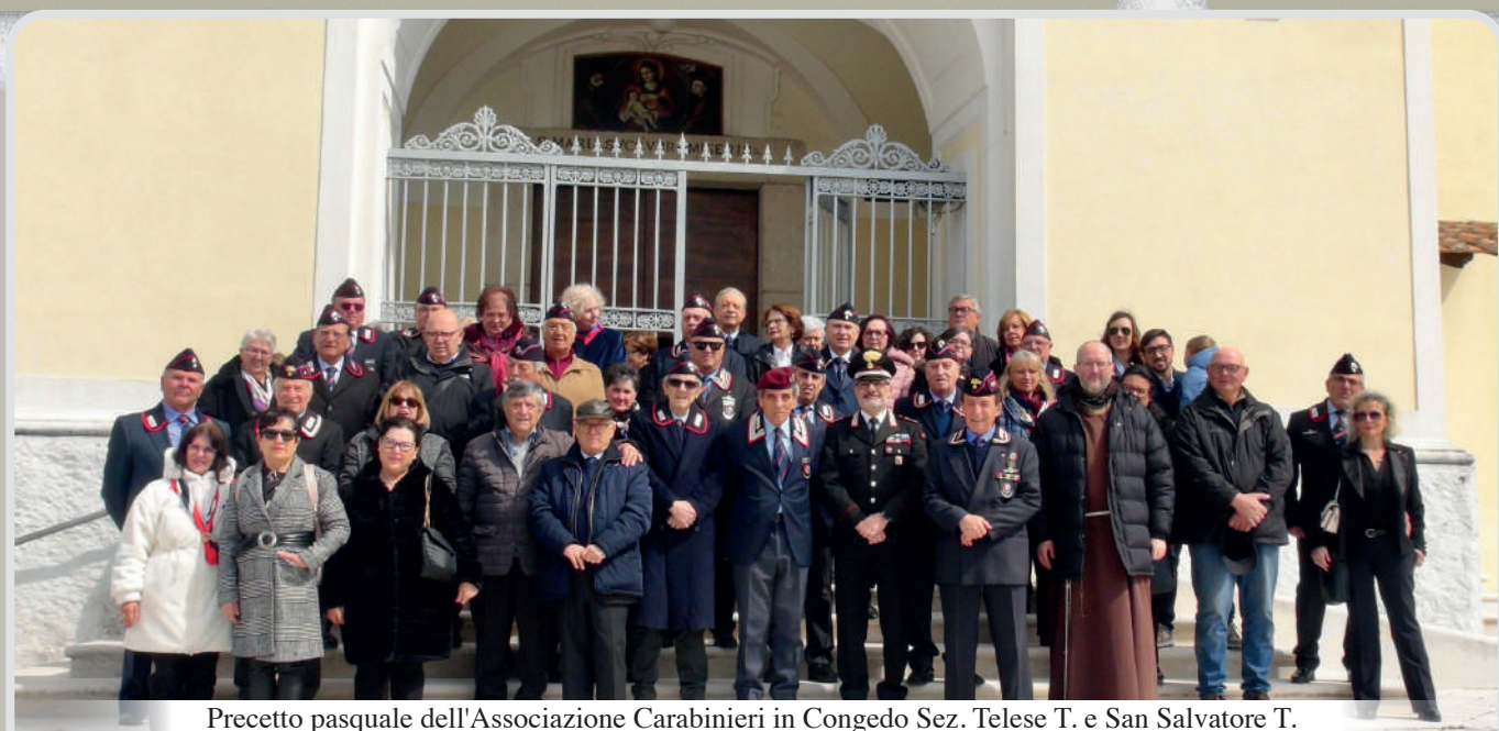
Precetto pasquale dell'Associazione Carabinieri in Congedo Sez. Telese T. e San Salvatore T.