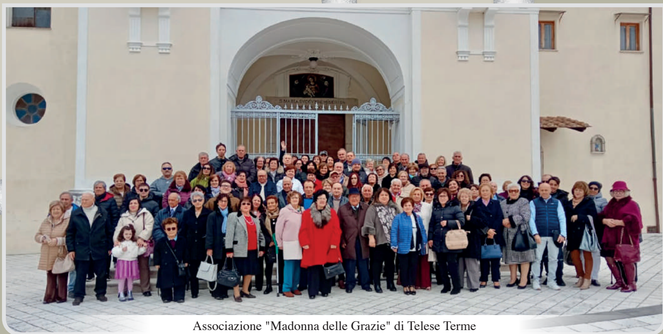
Associazione "Madonna delle Grazie" di Telese Terme