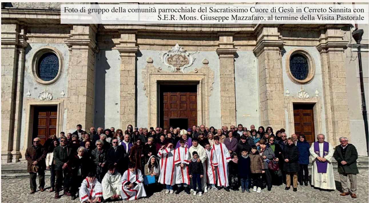
Foto di gruppo della comunità parrocchiale del Sacratissimo Cuore di Gesù in Cerreto Sannita con S.E.R. Mons. Giuseppe Mazzafaro, al termine della Visita Pastorale